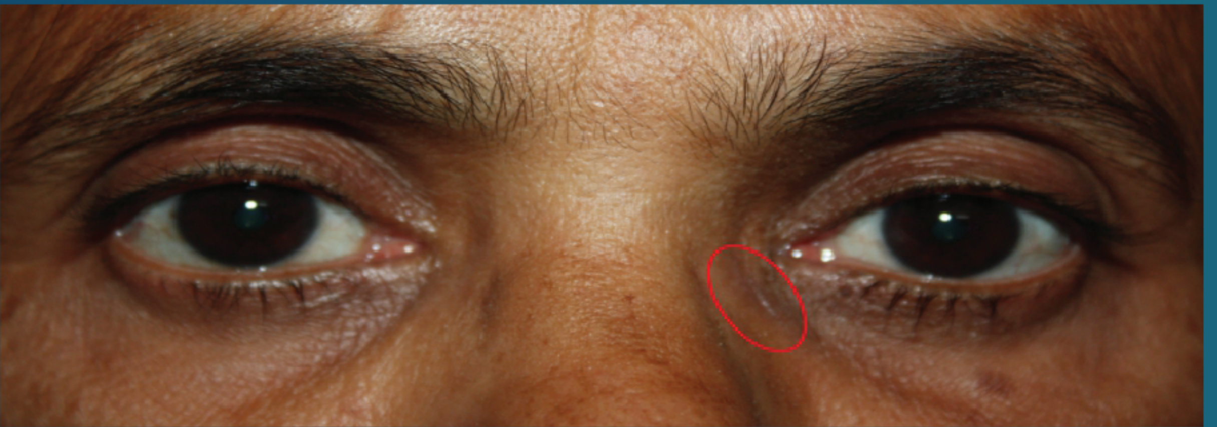
ಶಸ್ತ್ರಚಿಕಿತ್ಸೆಯ ನಂತರ ಇರುವ ಮಸುಕಾದ ಗಾಯ

ಮೂಗಿನ ಬದಿಯಲ್ಲಿ ಒಂದು ಪುಟ್ಟ ರಂಧ್ರವನ್ನು ಮಾಡಿ, ಕಣ್ಣೀರ ಚೀಲ ಮತ್ತು ಮೂಗಿನ ನಡುವೆ ಇರುವ ಒಂದು ಮೂಳೆಯನ್ನು ಕತ್ತರಿಸಿ ಕಣ್ಣೀರ ಚೀಲ ಮತ್ತು ಮೂಗಿನ ನಡುವೆ ಹೊಲಿಗೆ ಹಾಕಿ ಹೊಸ ಮಾರ್ಗವನ್ನು ಸೃಷ್ಟಿಸುತ್ತೇವೆ. ಕೆಲವು ರೋಗಿಗಳಿಗೆ ಶಸ್ತ್ರಚಿಕಿತ್ಸೆಯ ಸಮಯದಲ್ಲಿ ಸಿಲಿಕಾನ್ ಟ್ಯೂಬ್‌ನ್ನು ಮಾರ್ಗ ಮಧ್ಯದಲ್ಲಿ ಇಟ್ಟಿರುತ್ತೇವೆ. ಹೀಗೆ ಇಟ್ಟಿರುವ ಟ್ಯೂಬ್ ಅನ್ನು ಗಾಯ ವಾಸಿಯಾದ ನಂತರ 6-12 ವಾರಗಳಲ್ಲಿ ತೆಗೆದು ಬಿಡುತ್ತೇವೆ. ಈ ರೀತಿಯ ಶಸ್ತ್ರಚಿಕಿತ್ಸೆ ಕಣ್ಣಿನ ಬಳಿ ಒಂದು ಸಣ್ಣ ಕಲೆ ಉಳಿಯಬಹುದು. ಬಾಹ್ಯ ಡಿ.ಸಿ.ಆರ್ ತುಂಬಾ ಯಶಸ್ವಿ ಶಸ್ತ್ರಚಿಕಿತ್ಸೆಯಾಗಿದ್ದು, 100 ರೋಗಿಗಳಲ್ಲಿ 95 ಮಂದಿಗೆ ಈ ಸಮಸ್ಯೆಯಿಂದ ಪೂರ್ತಿಯಾಗಿ ಗುಣಮುಖರಾಗಿದ್ದಾರೆ.